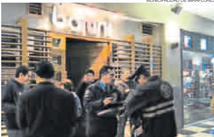
SANCIONADOS. The End, Dubal y Cameo son tres de las discotecas clausuradas por vender licor a menores de edad.

Según el burgomaestre, las razones de cierre van desde ocasionar ruidos molestos, hasta presentar inadecuadas condiciones de salubridad, manipular alimentos sin los cuidados higiénicos necesarios, carecer de certificados