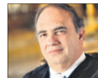
ANTONIO CANCADO TRINDADE (BRASIL)