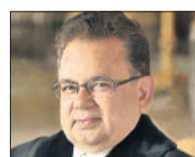
DALVEER BHANDARI (INDIA)