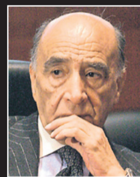
Luis Marchand Stens Ex ministro de Relaciones Exteriores (1990-1991).

Abogado graduado de la Universidad Nacional Mayor de San Marcos. Fue ministro de Relaciones Exteriores entre 1990 y 1991. Ejerció cargos como embajador del Perú ante la OEA, cargo al que renunció al producirse el autogolpe de Estado del 5 de abril de 1992. Presidió el Consejo Permanente de la OEA y el Grupo de los 77, y fue representante permanente alerno del Perú ante los organismos de las Naciones Unidas con sede en Ginebra. También fue titular del Consejo Interamericano Económico y Social (CIES), y dirigió el Consejo del Sistema Económico Latinoamericano (SELA). Se desempeñó también como embajador en Estados Unidos, Venezuela y Ecuador. Falleció el 1 de agosto del 2012.