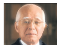
HISASHI OWADA (JAPÓN)