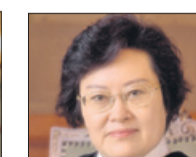
XUE HANQIN (CHINA)