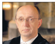
PETER TOMKA (ESLOVAQUIA) PRESIDENTE

Los magistrados de la Corte Internacional de Justicia de La Haya proceden de distintos países. Mantienen neutralidad respecto a su nacionalidad dado que dependen de la Organización de las Naciones Unidas.